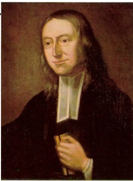
5.3 John Wesley

John Wesleys religiösa utveckling tvåhundra år senare påminner om Martin Luthers och är indirekt beroende av honom.