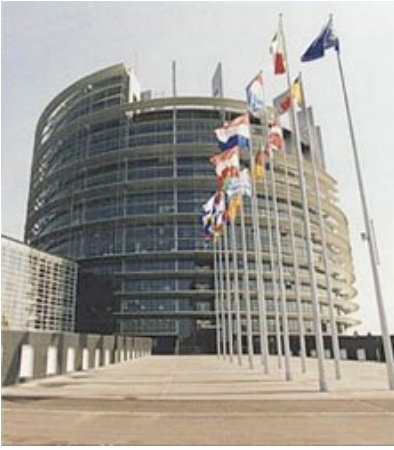
EU:s parlamentsbyggnad i Strasbourg