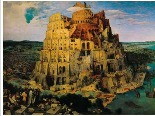
Peter Bruegels målning från 1563