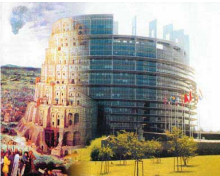
En mix av de båda ovanstående bilderna