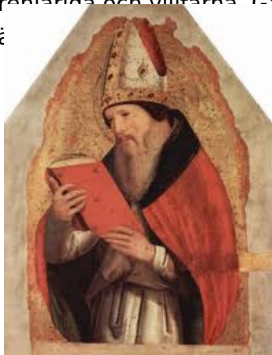
Kyrkans då mest framstående teolog, Augustinus (år

ämbetskyrka fortsatte mindre grupper att kämpa för sin frihet. Det var de som bar med sig det urkristna arvet, men de kom ändå att kallas för "kätterska" av ämbetskyrkan. Kyrkan menade alltså att de fria grupperna var avfälliga, icke renläriga och villfarna. Ganska snabbt uppstod det stridigheter mellan de fria församlingarna.