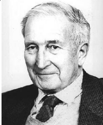
Anthony Flew - den störste ateisten av dem alla

Som du skall förstå lite längre fram i texten finns det väldigt många framstående vetenskapsmän som har en tro på en Gud i någon form. Många av dessa har tidigare varit evolutionstroende, men har genom sina upptäckter inom forskningen tvingats lämna en sådan tro till förmån för en tro på en Skapare. Jag skall lyfta fram några intressanta exempel som jag hämtat ur en bok som just handlar om prisbelönta forskare som börjat tvivla på Darwin. När man läser deras uttalanden förstår man att det inte längre är ett hållbart alternativ att tro på en storskalig evolution.