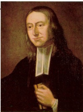
5.3 John Wesley

John Wesley's religiösa utveckling tvåhundra år senare påminner om Martin Luthers och är indirekt beroende av honom.