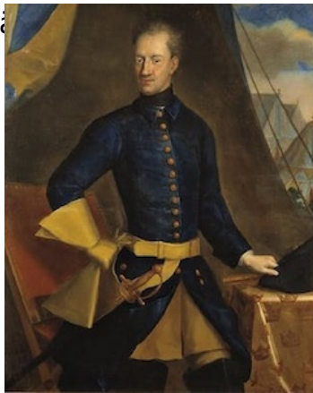
Karl XII griper in!

Men kung Ludvig nöjde sig inte med att utrota den evangeliska tron inom Frankrikes gränser. Han låg även bakom utrotandet av evangelisk-kristna (valdenser) i Piemontes dalar i Italien. Han vände även sin vrede mot tyska gränstrakter. Elsass, Strasbourg, furstendömet Orange, kurfurstendömena Köln och Pfalz, och hela området mellan Mosel, Rhen och Schwarzwald, drabbades av samma återkatolisering som Frankrike. Ludvig XIV fick i denna motreformatoriska kampanj god hjälp från Österrike-Ungern. Detta är ett exempel på den motreformation som Katolska kyrkans män iscensatte en tid efter trettioåriga kriget. MEN DÅ trä