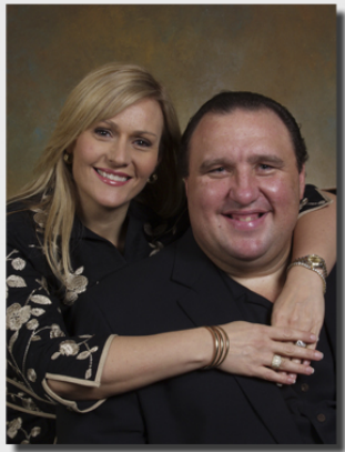
4.1 Rodney Howard Browne i Göteborg/Floda 26/11-3/12, 2010

TV-kanalen Vision Norge har nu etablerat sig i Floda lite utanför Göteborg. I månadsskiftet november/december 2010 hade Vision Norge en satsning i denna nya TV-studio/möteslokal med den sydafrikanske förkunnaren Rodney Howard Browne.